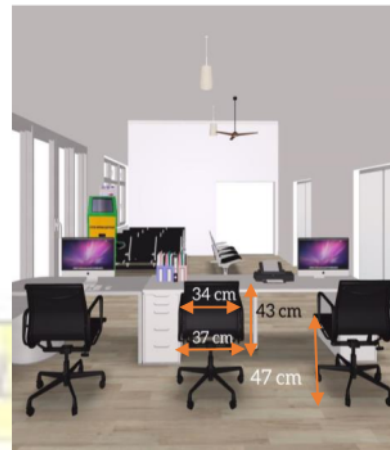
Gambar 3. Desain meja tampak belakang