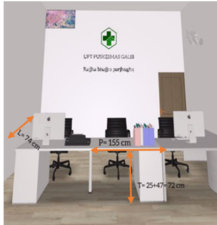
Gambar 1. Desain meja tempat depan

Hasil perancangan meja dan kursi petugas pendaftaran di Puskesmas Galis Pamekasan sebagai berikut :