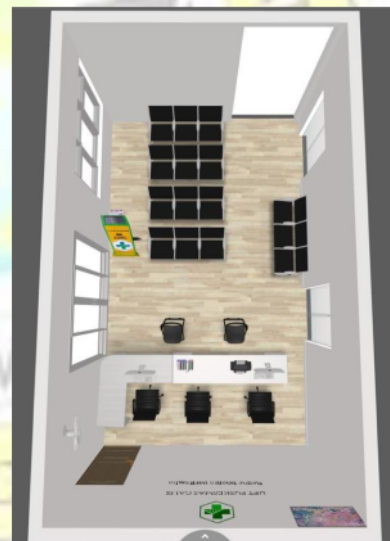
Gambar 4. Desain akhir tata ruang ergonomis pendaftaran pasien Pada gambar diatas posisi meja dan kursi sudah di ukur keergonomisannya