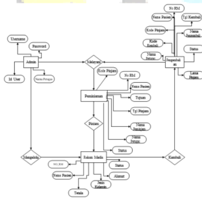
Gambar 4. Entity Relationship Diagram (ERD) Sistem Peminjaman dan Pengembalian Desain Entity

Berikut merupakan Entity Relationship Diagram (ERD) dari sistem peminjaman dan pengembalian rekam medis di Puskesmas Teja