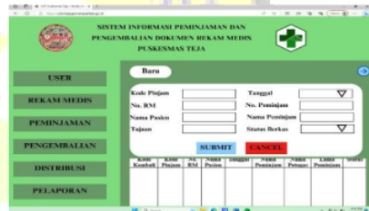
Gambar 8. Tampilan menu peminjaman