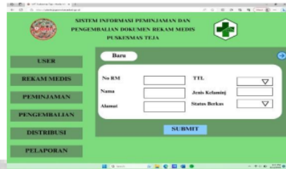
Gambar 7. Menu rekam medis