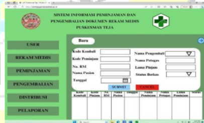
Gambar 9. Tampilan menu pengembalian