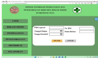
Gambar 10. Tampilan menu laporan