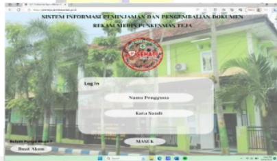
Gambar 5. Tampilan login